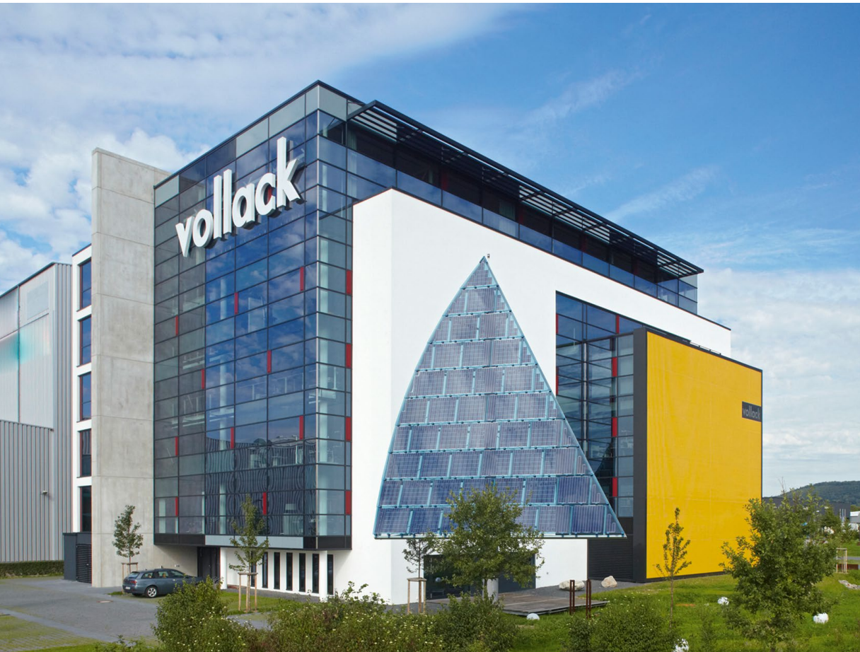
Vollack FORUM 1, Karlsruhe