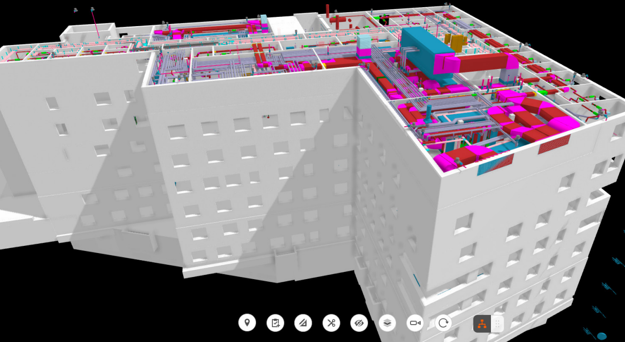
Projektanlage in Bimplus zur Anbindung externer Fachplaner.

Bauaufgaben, bei denen BIM kaum mehr wegzudenken ist. So profitieren hochtechnisierte Gebäude wie Krankenhäuser oder Spezialkliniken immens vom digitalen Modell: Komplexe Fachplanungen lassen sich umfassend einbinden, abgestimmt koordinieren und Planungsfehler so minimieren. Das entwerfende Architekturbüro wird damit wieder zum wesentlichen Projektsteuerer in der Planung wie im Bauprozess.