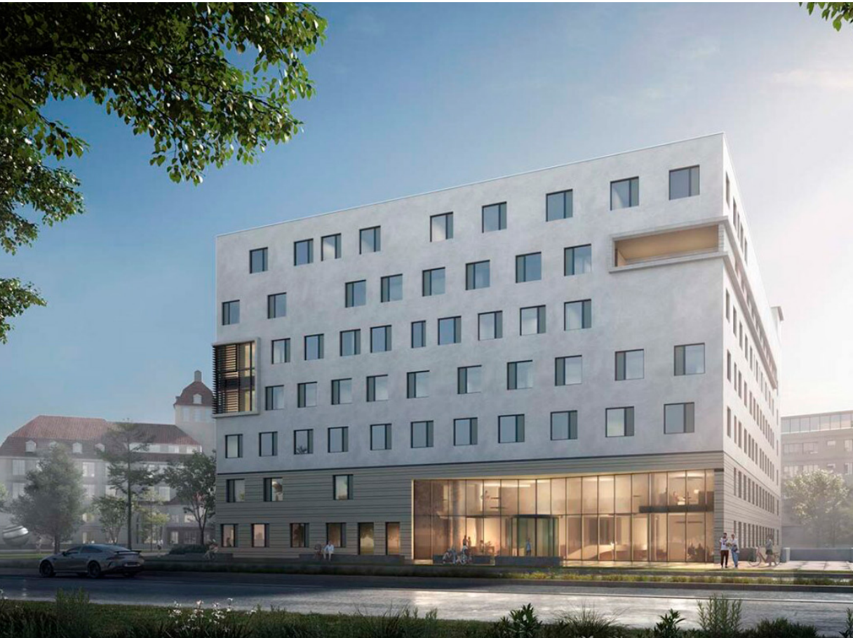
Strahlenklinikum Stuttgart. © SWECO GmbH