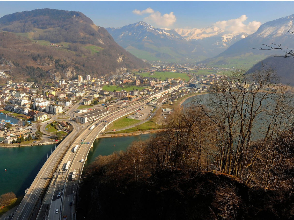
Autobahn A2, Stansstad-Beckenried