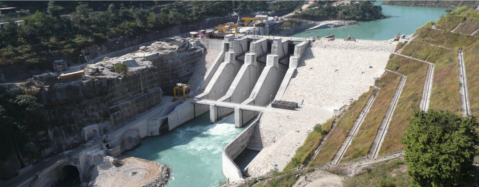
Projekt: Wasserkraftwerk Middle Marsyangdi, Nepal, Bauunternehmer DYWIDAG International GmbH

Allplan Gelände richtet sich an Architekten, Stadt- und Landschaftsplaner sowie Bauingenieure. Im Zusammenspiel mit Allplan Architecture oder Allplan Engineering können Hoch- und Tiefbauten unter Berücksichtigung des realen Geländeverlaufs, des städtebaulichen Umfelds und des umgebenden Straßennetzes effizient geplant werden.