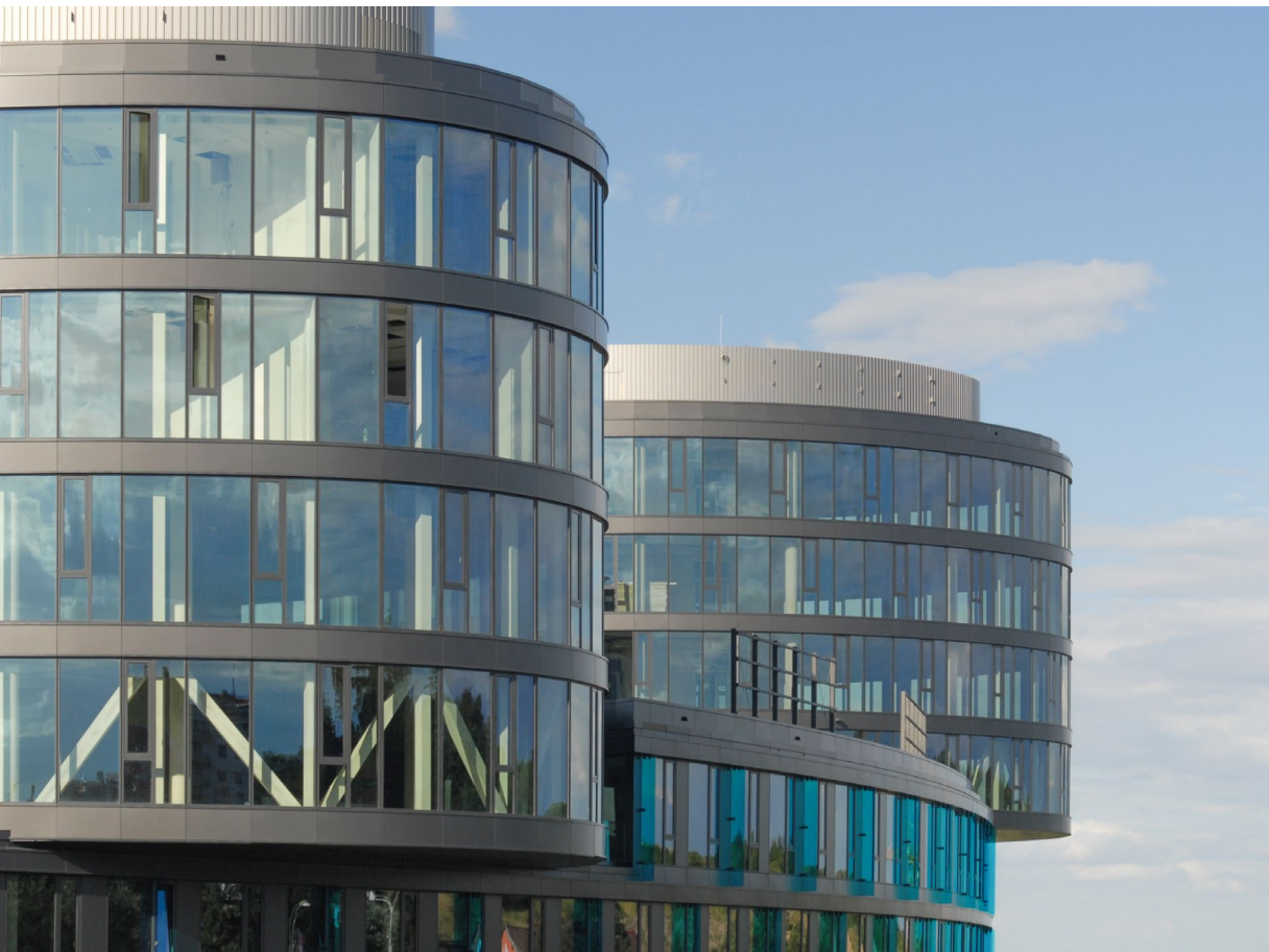
Bürogebäude Aviatica, Prag, Tschechische Republik