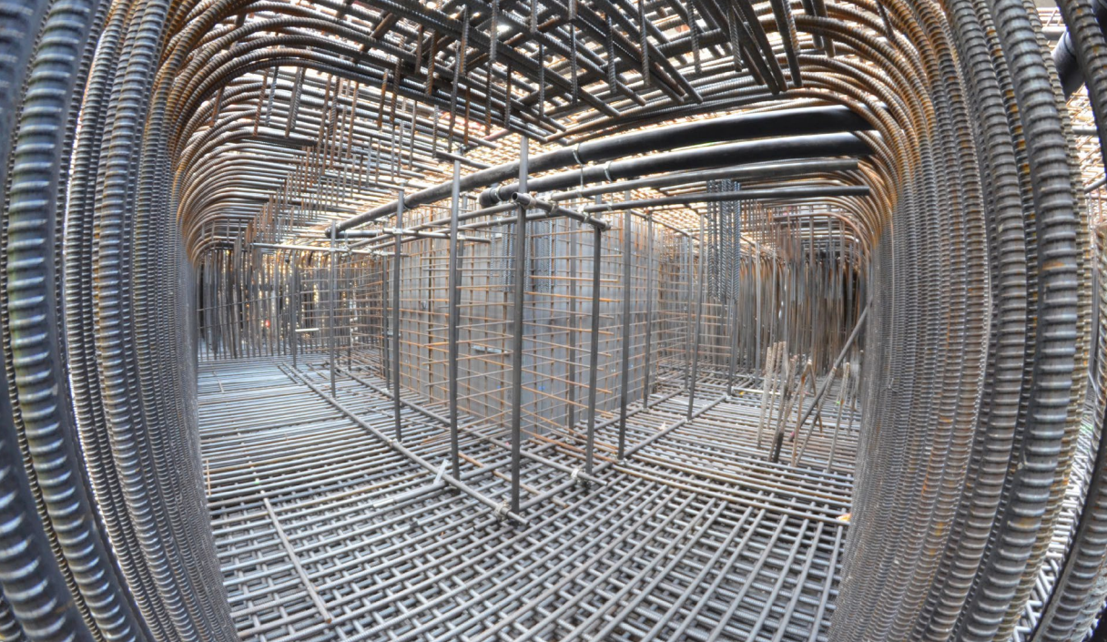
Zwischen den Bewehrungslagen