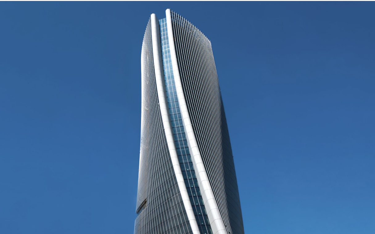
Zaha Hadid Tower im Citylife-Bezirk, Mailand (Italien), Redesco Progetti S.r.l.