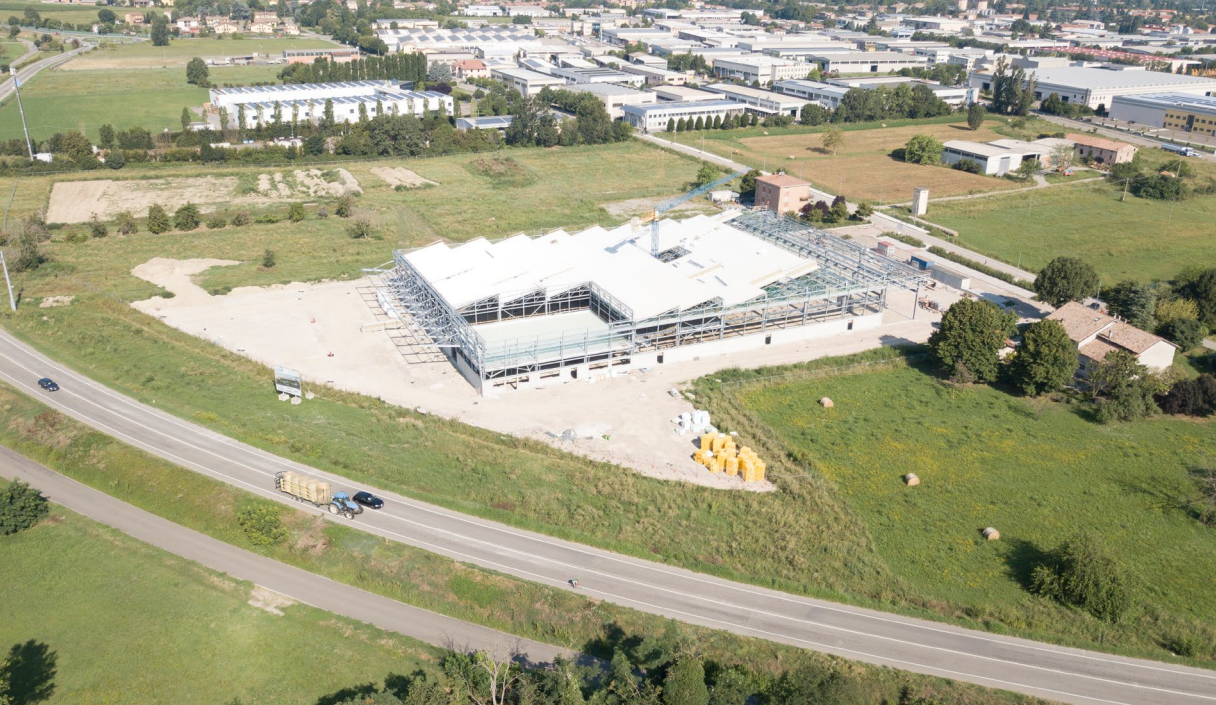
Fotografia d'insieme della fase di posa della copertura