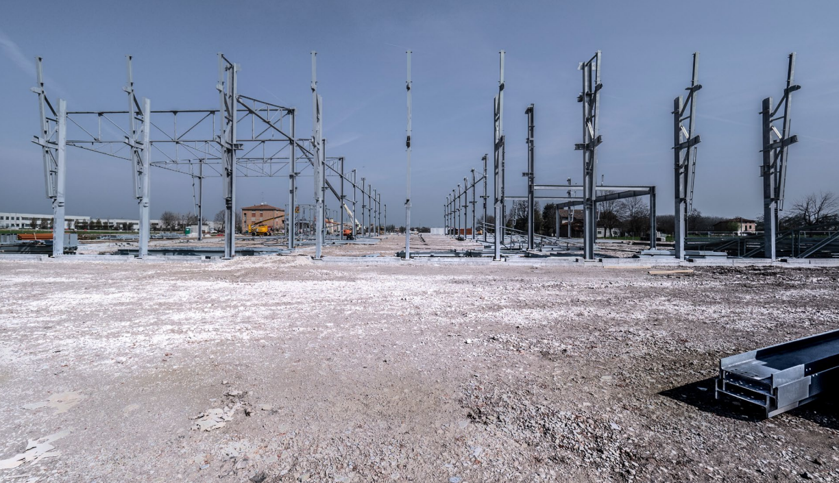
Installazione delle strutture in carpenteria metallica