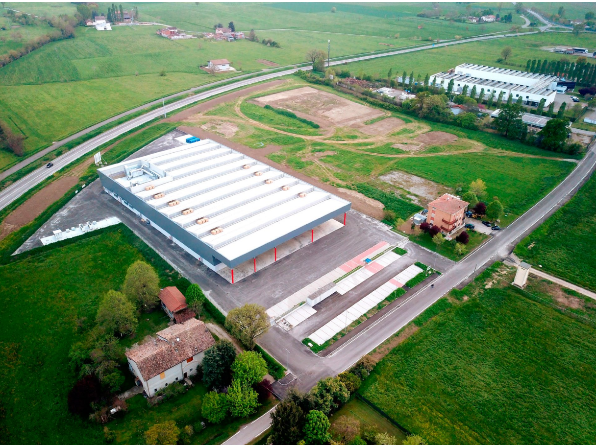
Fotografia d'insieme del nuovo complesso produttivo a lavori ultimati