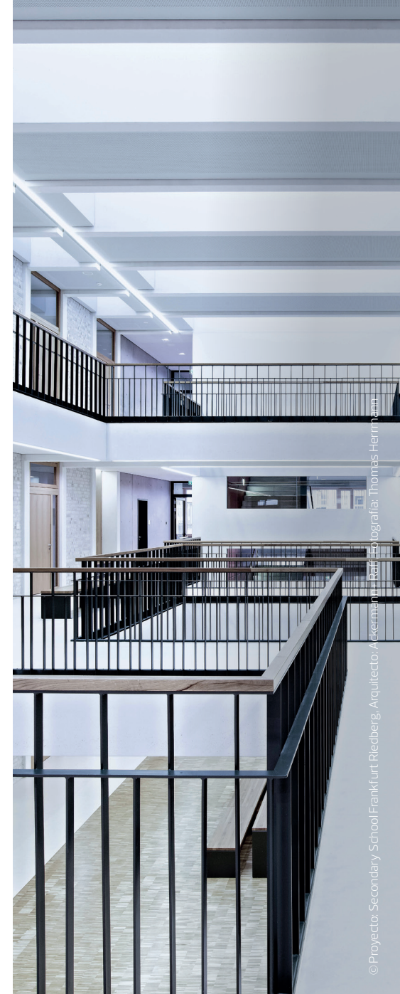
© Proyecto: Secondary School Frankfurt Riedberg, Arquitecto: Ackermann + Partner, Fotografía: Thomas Herrmann

MANTENGA TODO BAJO CONTROL CON UNAS MEDICIONES FIABLES