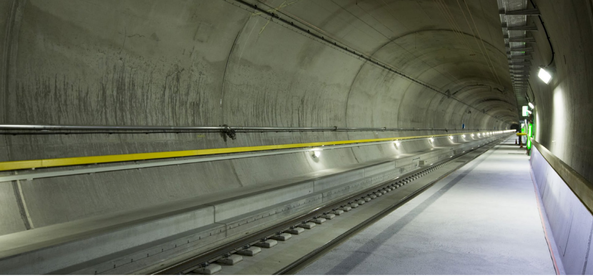
System mit zwei Einspurrohren von je 57 km Länge