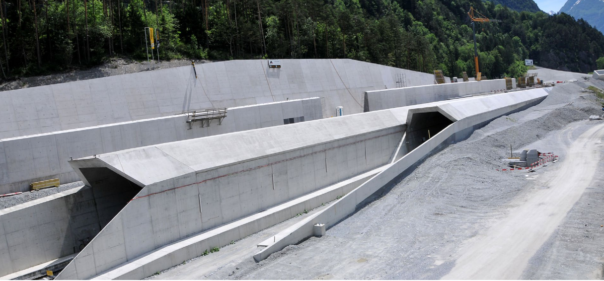
Portale Gotthard- Basistunnel Nordseite bei Erstfeld

beginnen konnten, musste ein 1,8 Kilometer langer Zugangsstollen gebaut werden. Anschliessend folgte der Ausbruch eines „Fusspunktes“ mit Bahntechnik-kaverne, Baustollen und Kreuzungsbauwerken. Für die spätere Bahnstromversorgung bohrte eine Tunnelbohrmaschine mit 3,7 Meter Durchmesser einen 1,8 Kilometer langen Kabelstollen in die unterirdische Zentrale des Kraftwerks Amsteg. Im Sprengvortrieb wurden die ersten 400 Meter jeder Tunnelröhre und die Montagekavernen für den Aufbau der Tunnelbohrmaschinen ausgebrochen. In einem zeitlichen Abstand von drei Monaten startete der Leistungsvortrieb der beiden Tunnelbohrmaschinen in Richtung Sedrun. In der Weströhre kam es nach der problemlosen Durchquerung einer prognostizierten Störzone zu einem überraschenden Stillstand des Vortriebs: Ein Wasserzutritt schwemmte loses Material in den Bohrkopf und blockierte diesen. Für die Befreiung der Tunnelbohrmaschine wurde aus der Oströhre ein Gegenvortrieb erstellt und die gesamte aufgelockerte Zone mit massiven Injektionen verfestigt. Nach einem Stillstand von rund sechs Monaten konnte der Regelvortrieb wieder aufgenommen werden. Mit einer durchschnittlichen Tagesleistung von 11,05 Metern konnte der Durchschlag beider Röhren zum Teilabschnitt Sedrun trotz des Stillstandes mit mehrmonatigem Zeitvorsprung gefeiert werden.