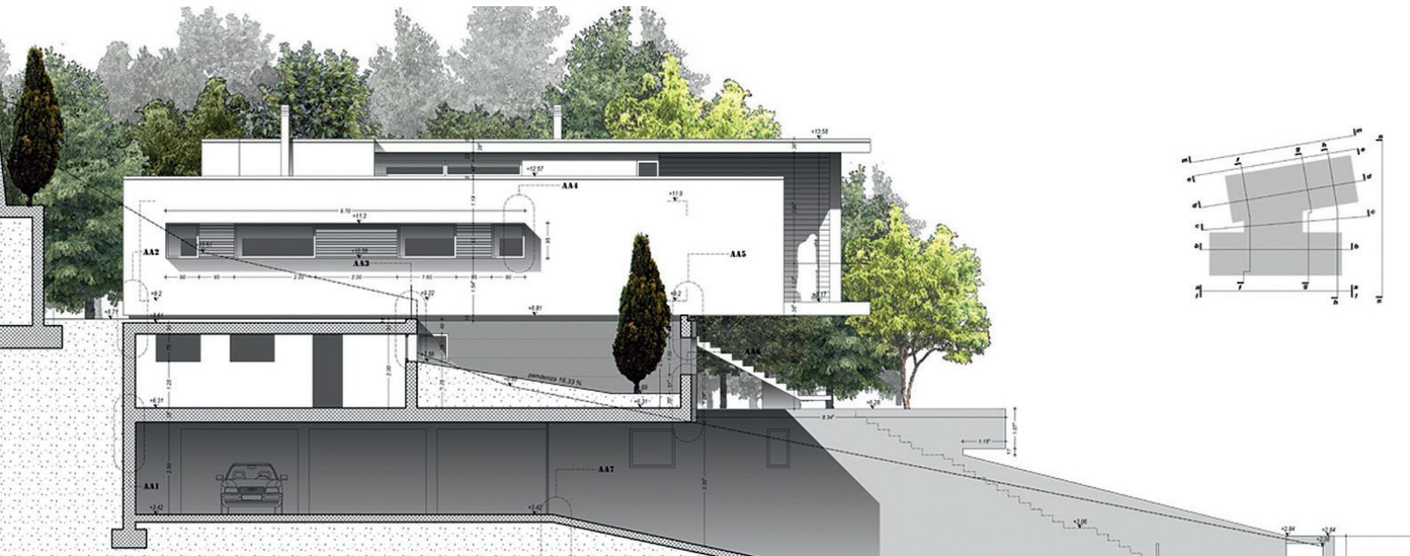
Projekt: Einfamilienhaus, Boario Terme, Italien / Arch. Massimo Nodari, Italien

Allplan Basis ist ein bauspezifisches CAD-System, das den kostengünstigen Einstieg in die Allplan Welt ermöglicht. Es beinhaltet einfache Werkzeuge zum Konstruieren und Dokumentieren. Für einen reibungslosen Datenaustausch sind die gängigen Schnittstellen vorhanden (u.a. DWG, DXF, DGN, PDF).