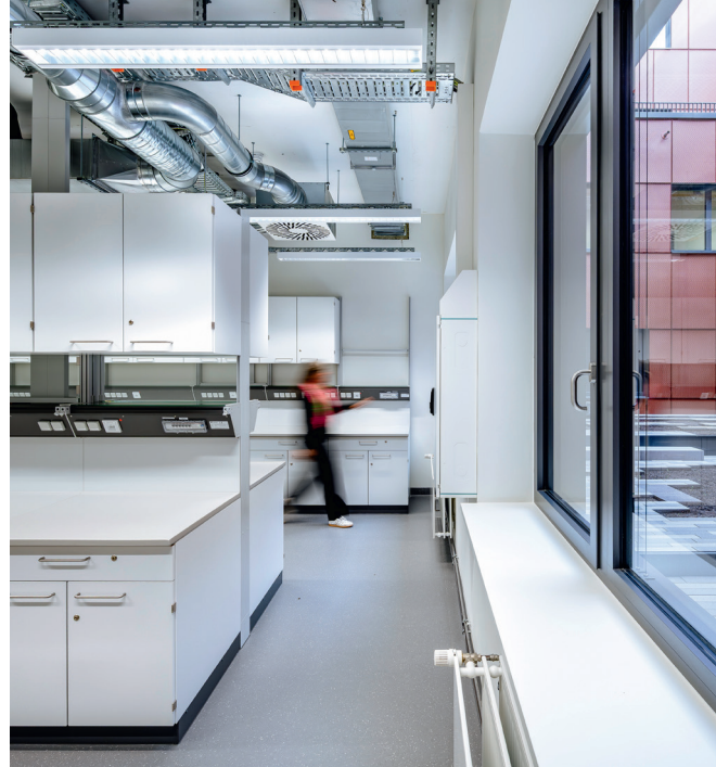
Die Geschosse im Gebäude sind klar strukturiert – mit Laboren auf der einen und Büros auf der anderen Seite, die sich um ein zentrales Atrium legen.