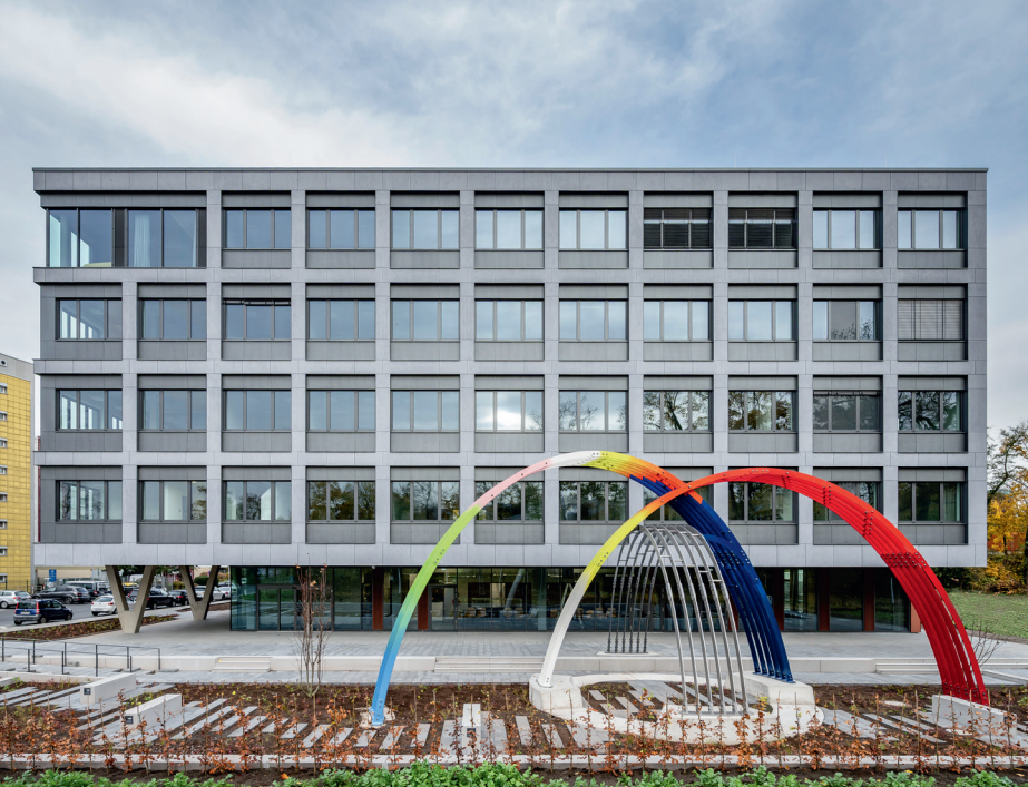
Zentrales Bindeglied: Der Standort des ITMP in Frankfurt unweit vom Campus der Universität Niederrad. Diese Nähe verankert das neue Institutsgebäude als elementaren Baustein im gegebenen Forschungskontext vor Ort.