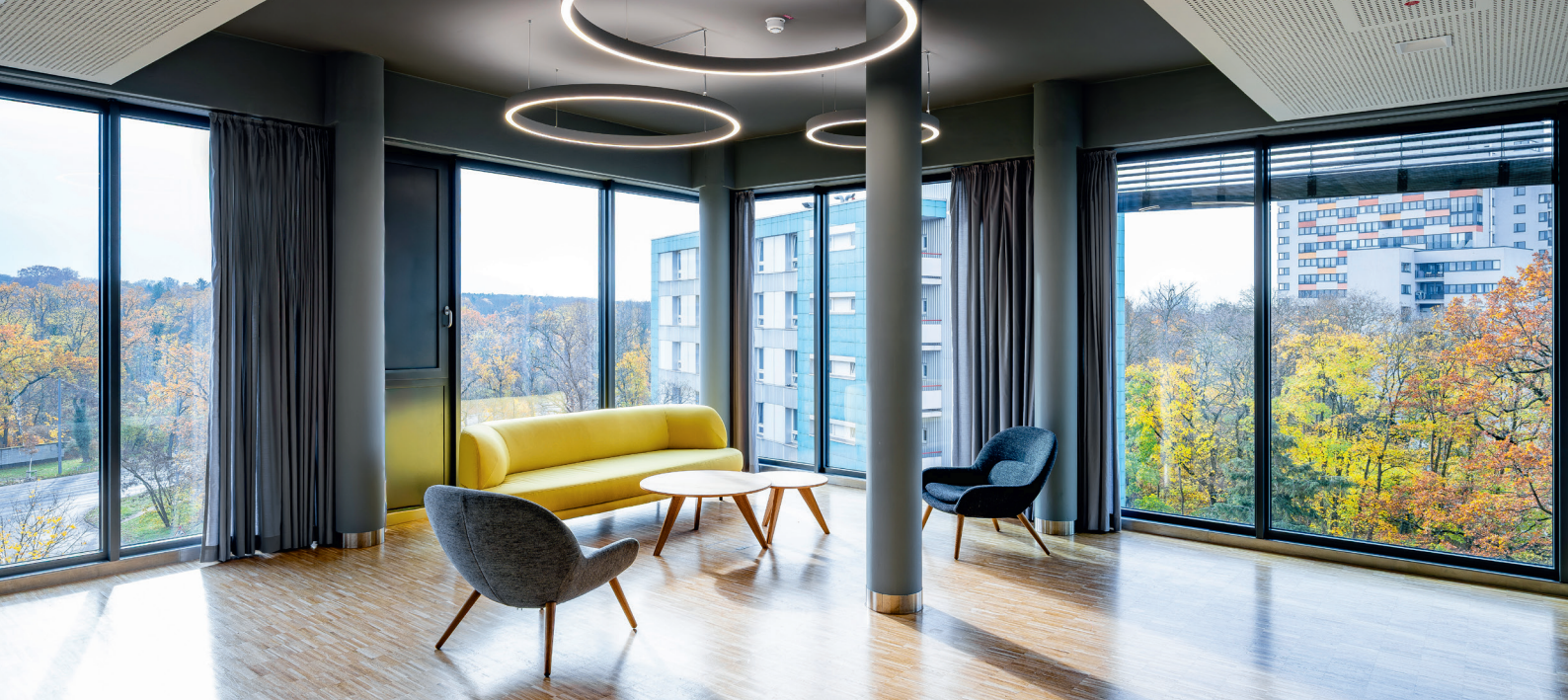
Gemeinsames Arbeiten an hellen Arbeitsplätzen und in offenen, flexiblen Raumstrukturen.