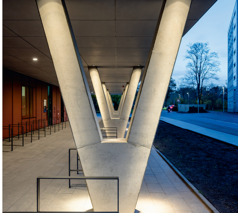
Die eleganten V-Stützen innerhalb der tragenden Konstruktion belegen: Ein zentrales Planungsmodell war wichtig bei der Zusammenarbeit mit der Tragwerksplanung.